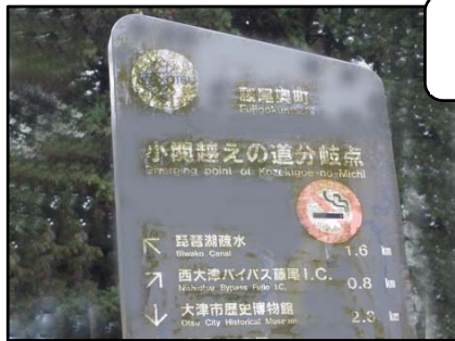
琵琶湖疎水完歩ウォークシリーズ(3回)