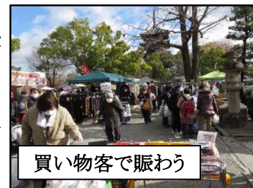
買い物客で賑わう

な、お正月商品が出品され、お目当てのお客さんで大いに賑わっていました。コロナの早い終息を願い今年の例会を閉じました。