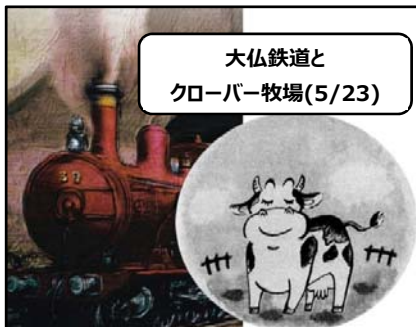
大仏鉄道と クローバー牧場(5/23)