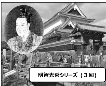
明智光秀シリーズ(3回)