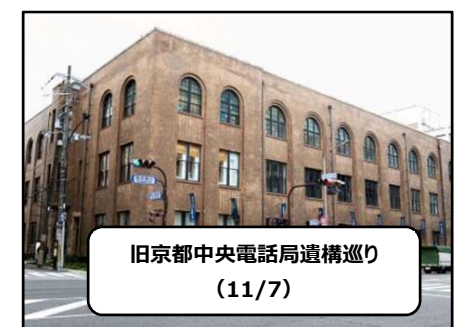
旧京都中央電話局遺構巡り (11/7)