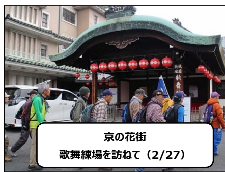
京の花街 歌舞練場を訪ねて(2/27)